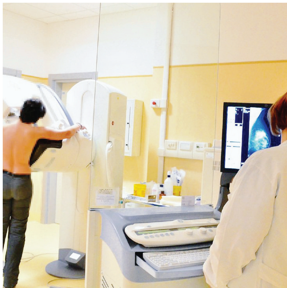
Una paziente mentre si sottopone all'esame della mammografia